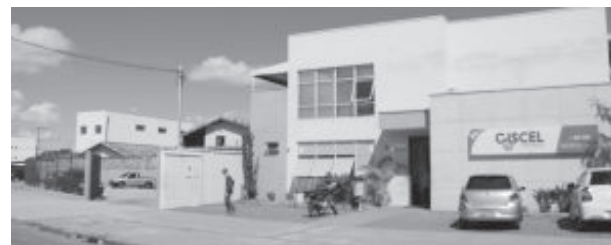
Sede do Ciscel e garagem que dará lugar a obra

Atualmente, as 12 cidades associadas estão em dia com seus repasses ao Ciscel, mesmo as que