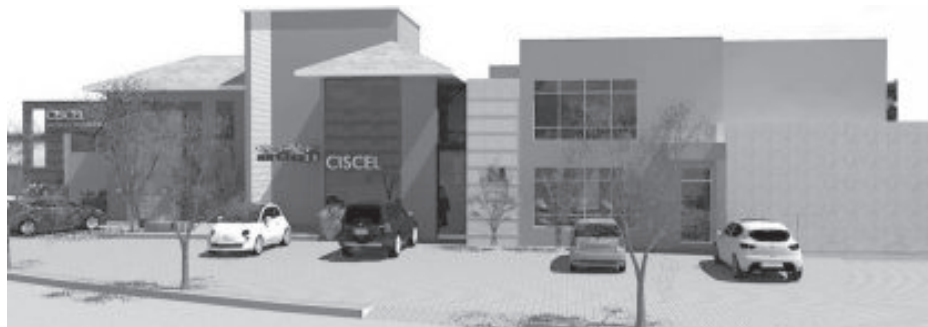
Desenho arquitetônico do Ciscel ampliado

O projeto contempla a construção de uma sala para arquivos de prontuários e documentos diversos. Atualmente, o Ciscel paga R$ 1 mil por mês para manter um ar-