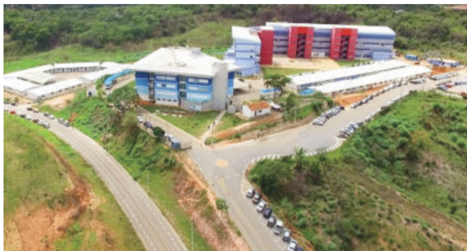
Campus da Unifei. Mais três novos prédios começam a ser erguidos neste ano

Em resposta a solicitação do Folha Popular , a diretoria do Campus Unifei/Itabira ratificou os dados que apontam um volume financeiro de R$ 260 milhões/ano em Itabira até 2028. “Esses números são estimativas baseadas nos gastos médios de servidores e alunos” , respondeu a diretoria