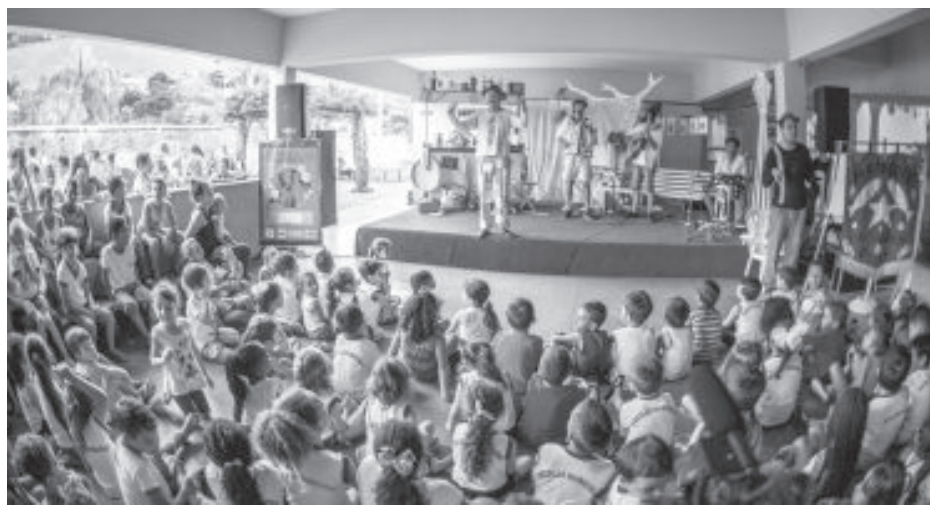
Apresentação contará com participação de alunos da rede municipal