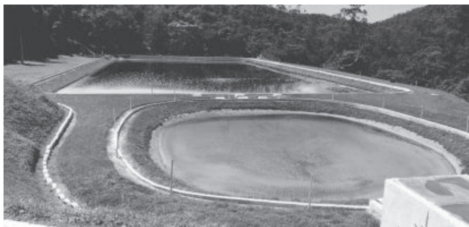
Secretária garante que lagoas não oferecem risco de infiltração de chorume