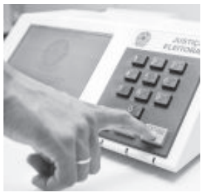
Eleições unificadas aconteceriam em 2023