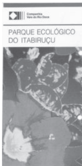
O Itabiruçu tinha o objetivo de servir como mostruário de flora regional, refúgio da fauna e área de apoio aos programas ambientais

Esta área tinha o objetivo de servir como mostruário de flora regional, refúgio da fauna e área de apoio aos programas conservacionistas da empresa, principalmente educação ambiental.