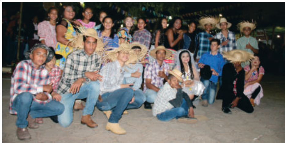
Grupo de quadrilha Pé na Roça fez apresentação empolgante