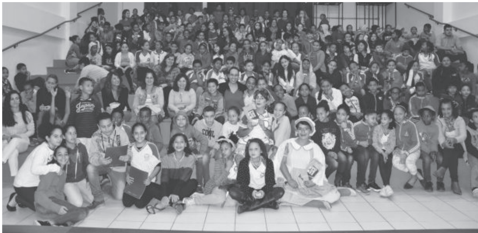
Estudantes de São Gonçalo do Rio Abaixo durante o lançamento da edição 2019 do Câmara nas Escolas

No final das apresentações, cada aluno rece-