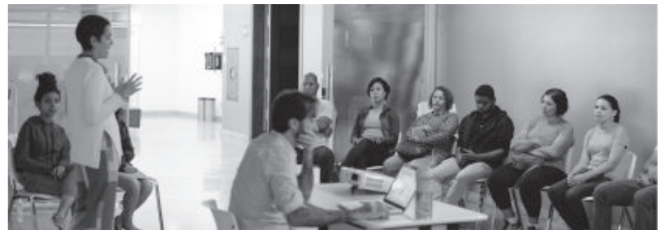
A Prefeitura oferece consultoria gastronômica aos comerciantes do setor

As baixas temperaturas do mês de julho serão regadas a muito tempero e cultura em São Gonçalo do Rio Abaixo. Boa comida e shows de qualidade vão movimentar a cidade nos dias 27 a 28 de julho, na praça Central.