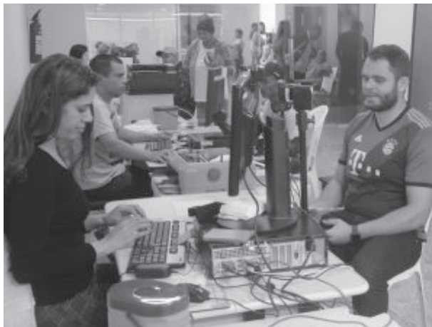
A unidade itinerante fica em São Gonçalo até o dia 7 de julho

Por conta de um problema de no link do Tribunal Regional Eleitoral (TRE) as atividades ti-