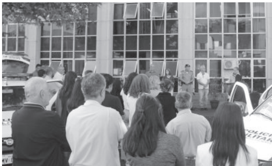
Veículos foram entregues ao comando do 26º Batalhão na sexta-feira (14)