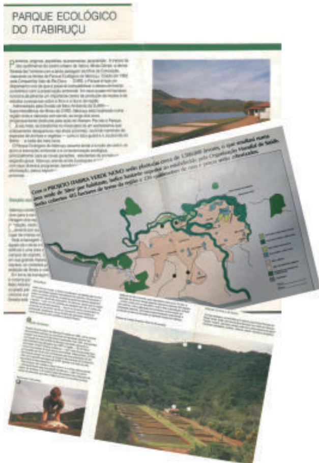
Páginas de revista montada pela Vale com as ações que deveriam ser executadas conforme acordo judicial em 1993