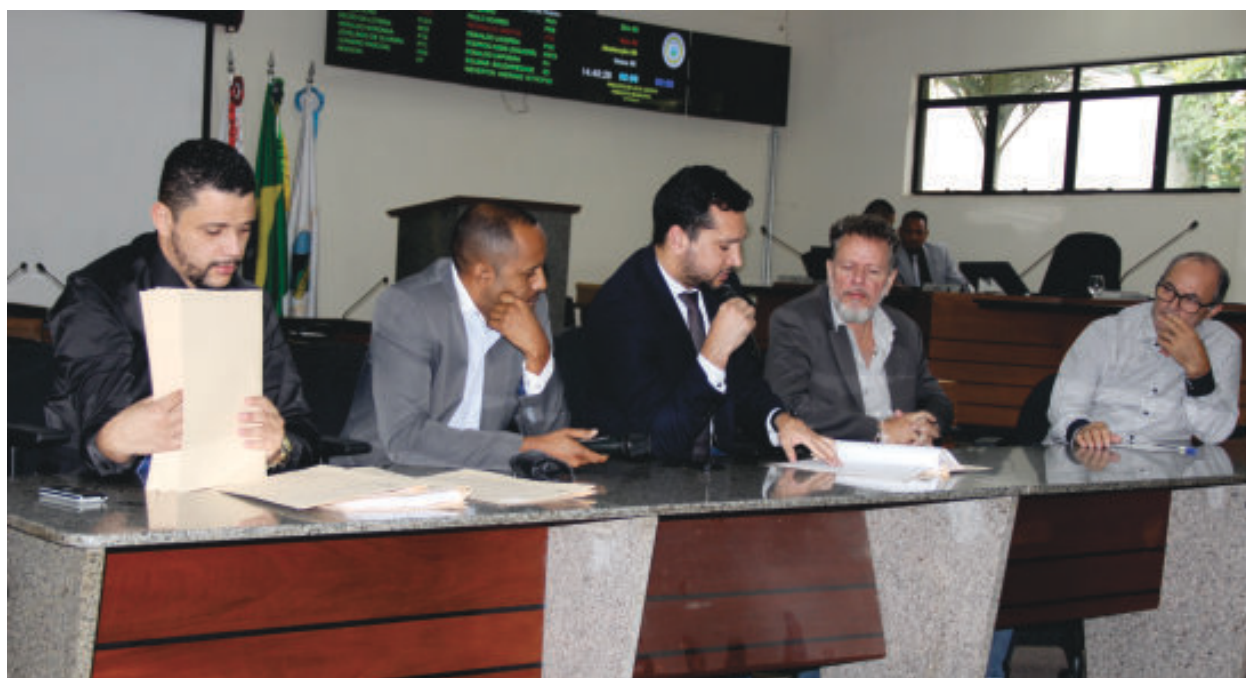
Entre os projetos liberados para esta terça (18) está o que obriga o comparecimento de secretários

Também na quinta-feira, a reunião das comissões temáticas da Câmara liberou para votação na sessão desta terça-feira (18), proposta de emenda à Lei Orgânica que obriga o comparecimento do secretariado municipal quadrimestralmente às sessões das comissões, para prestarem informações sobre a gestão de suas respectivas secretarias.