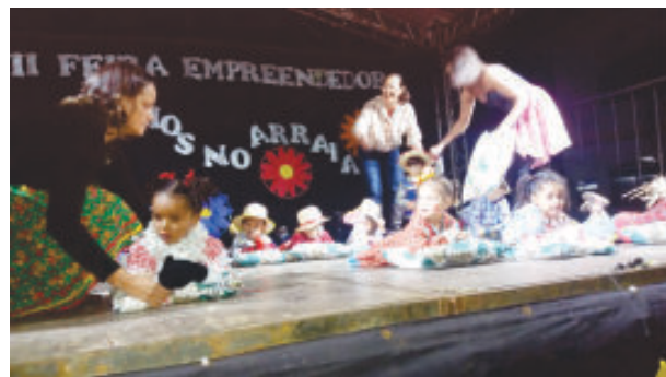
No palco, as crianças também foram show

A culminância do projeto é aberta ao público e apresenta produtos diferenciados disponibilizados em estandes no Centro da cidade. O evento conta com parceria da Secretaria Municipal de Educação e apoio da Prefeitura Municipal.