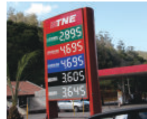
Posto TNE/Monlevade: gasolina R$ 4,695 e etanol R$ 2,895

A expectativa de que a gasolina e o etanol em Itabira iriam acompanhar a praça de João Monlevade terminou como um vôo de galinha, não foi longe.