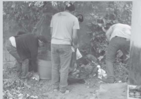
Outros mutirões já estão agendados para o mês de junho

Até o final de maio, cidade registrou 128 casos suspeitos da doença e 51 confirmações