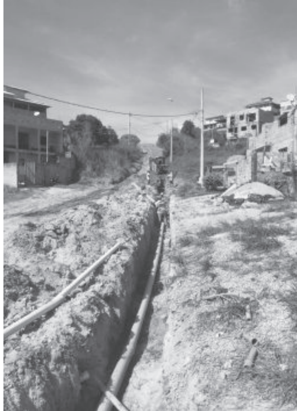
Obras no bairro Colina da Praia

A proposta do governo é atender o maior número de localidades que ainda não contam com o serviço.