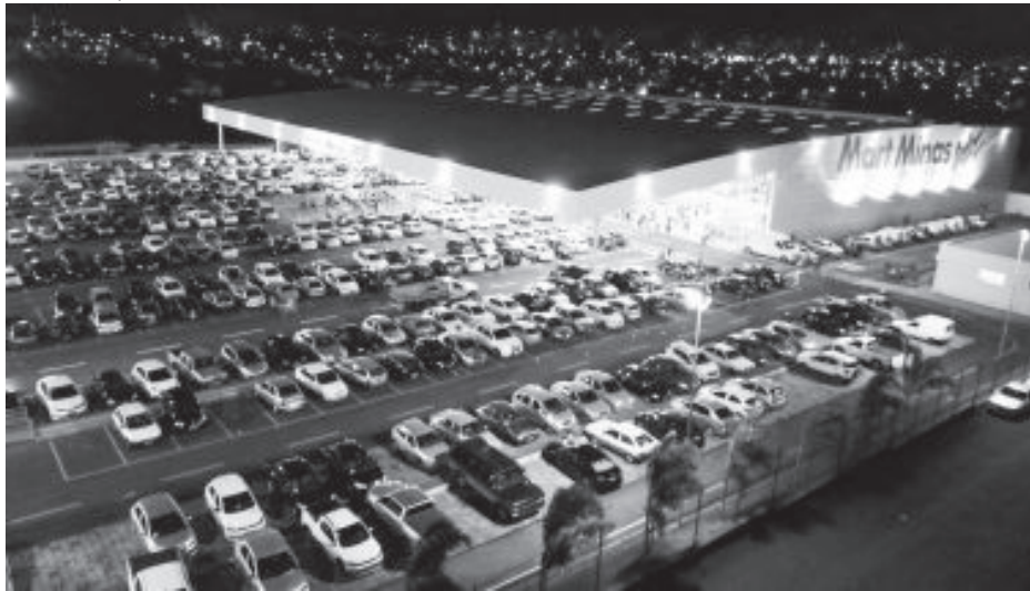
Unidade em Itabira promete preços baixos e grande variedade de produtos

FOTO: ILUSTRAÇÃO DE UNIDADE JÁ INSTALADA