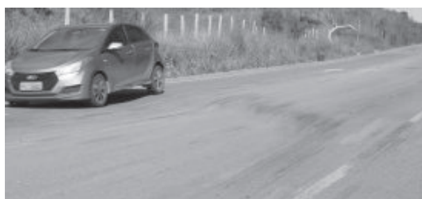
Carro ao passar pelo baque chega a contorcer