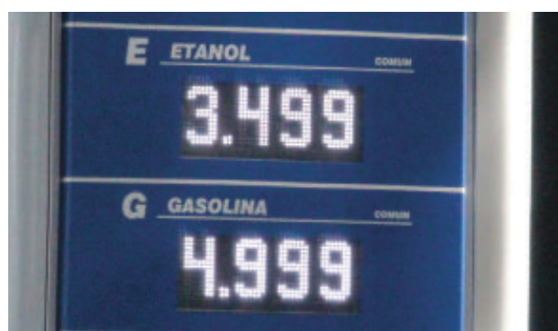
Em pelo menos 12 postos em Itabira os preços são idênticos ou bem próximos