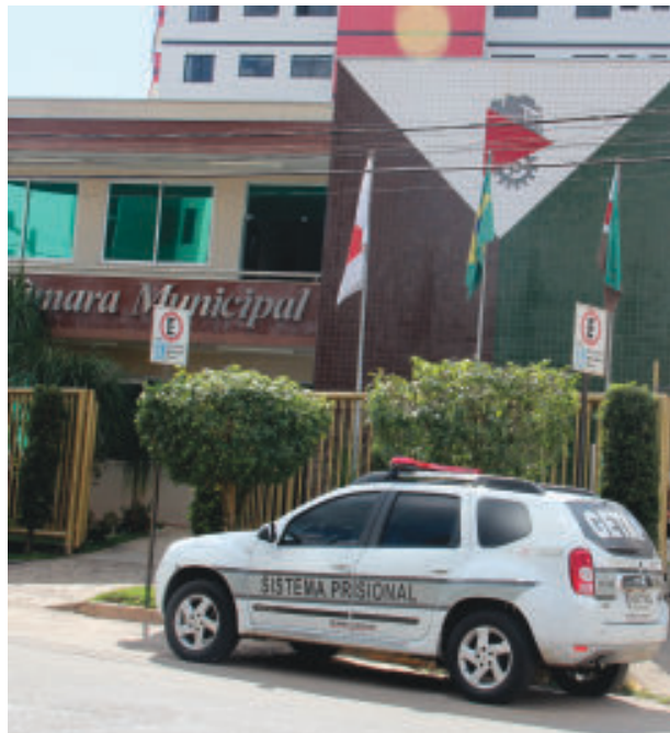
Câmara instituiu o privilégio em 2011, o que já consumiu cerca de R$ 2,5 milhões nos últimos anos