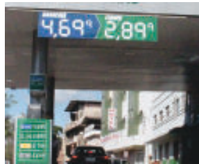
Rede Longana/Monlevade: gasolina R$ 4,699 e etanol R$ 2,889