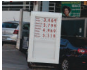
Rede Campestre/Itabira: gasolina R$ 4,969 e etanol R$ 3,469