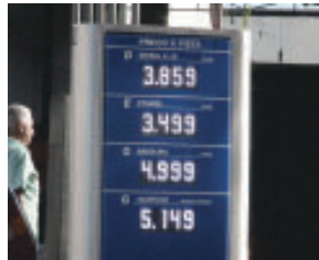
Grupo Pires/Itabira: gasolina R$ 4,999 e etanol R$ 3,499