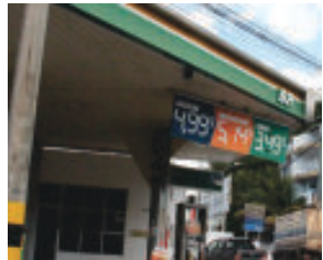
Rede Longana/Itabira: gasolina R$ 4,999 e etanol R$ 3,499

REGISTROS FEITOS NOS DIAS 30 E 31 DE MAIO (PREÇOS DE GASOLINA COMUM)