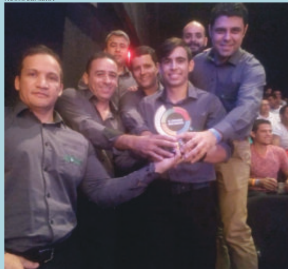
Prêmio foi entregue dia 30 de maio à equipe da Cenibra