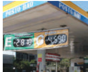
Posto Baú/Monlevade: gasolina R$ 4,590 e etanol R$ 2,810