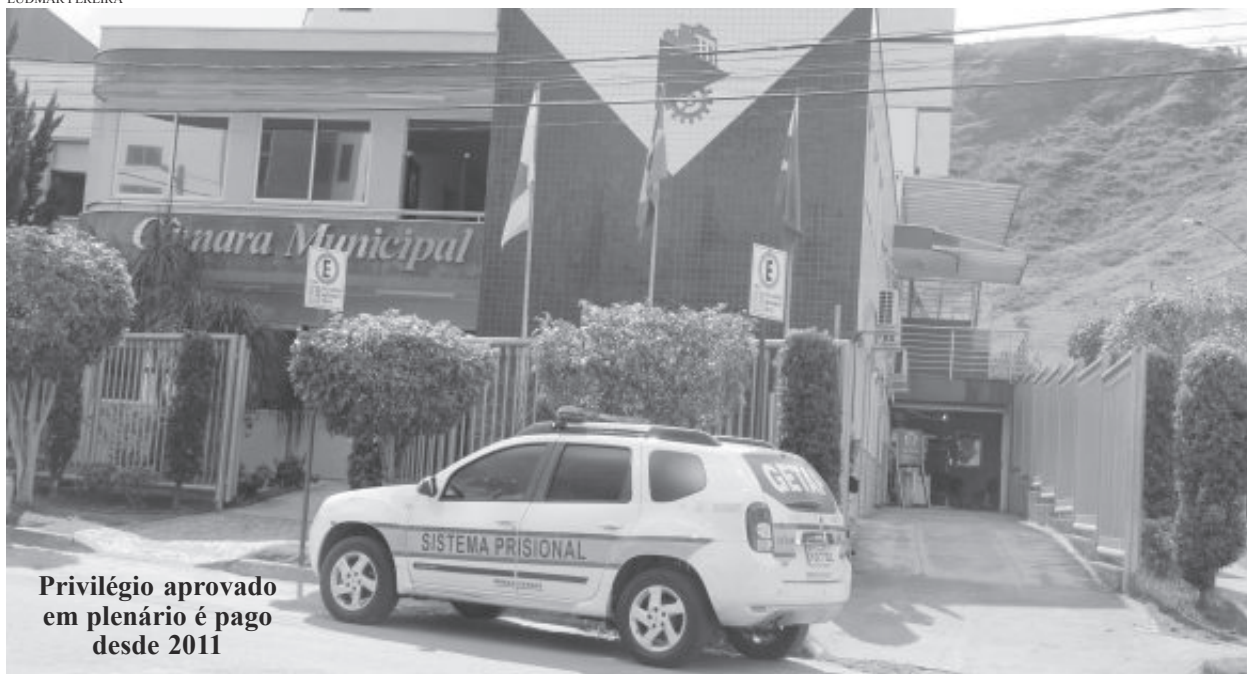
Privilégio aprovado em plenário é pago desde 2011

zar. Não sou contra o Djalma. Acredito que ele vai apresentar um projeto de iniciativa popular para acabar com o 14º salário", diz Leles Pontes.