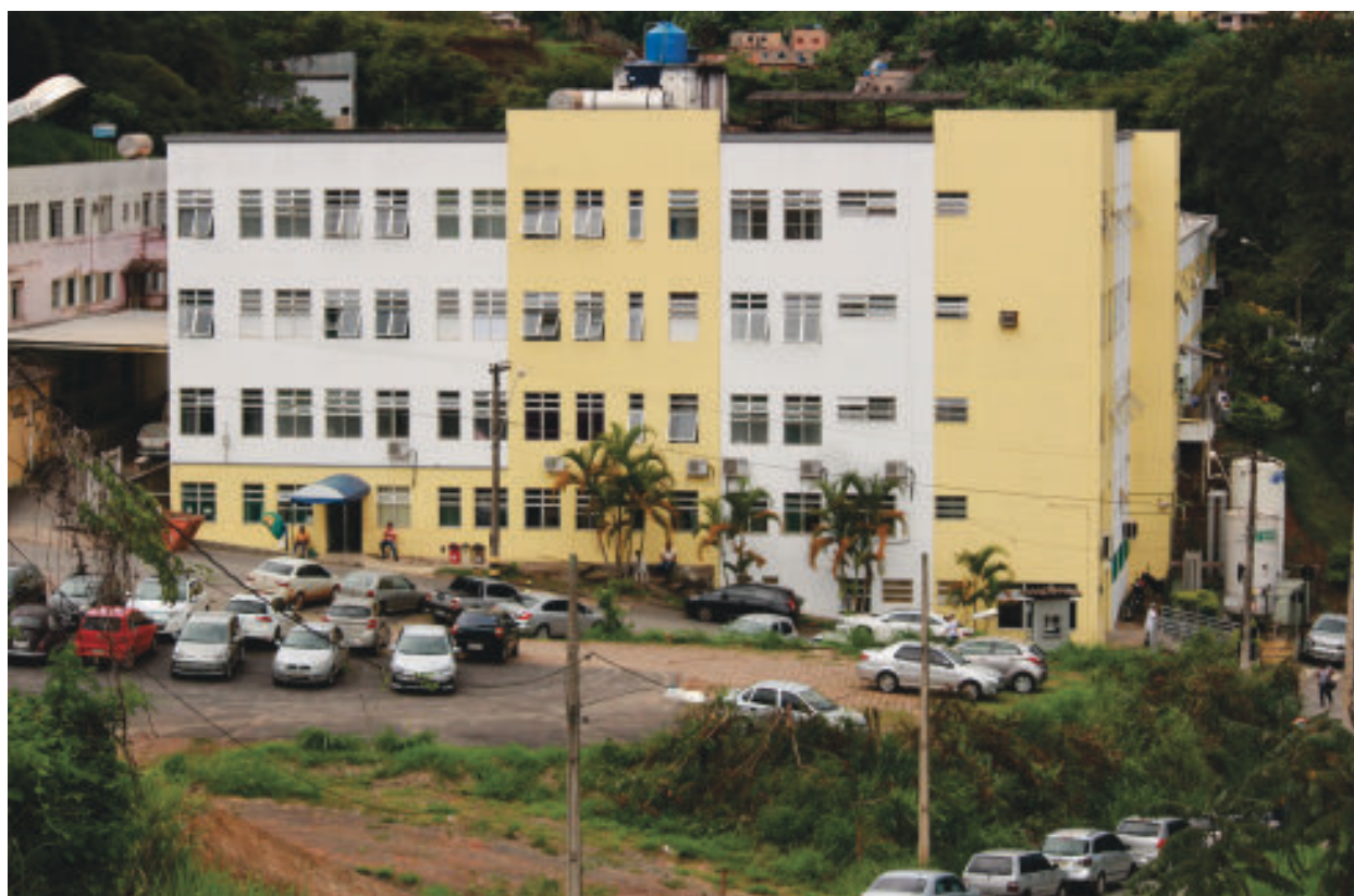
Conforme destaca o documento da Anvisa, a segurança do paciente no HNSD envolve a avaliação permanente dos riscos em serviços de saúde e requer ações como o uso de protocolos específicos

Conforme destaca o documento da Anvisa, a segurança do paciente envolve a avaliação permanente dos riscos em serviços de saúde e requer ações como o uso de protocolos específicos e estabelecimento de barreiras de segurança nos sistemas e gestão dos eventos adversos para prevenir e reduzir riscos e danos.