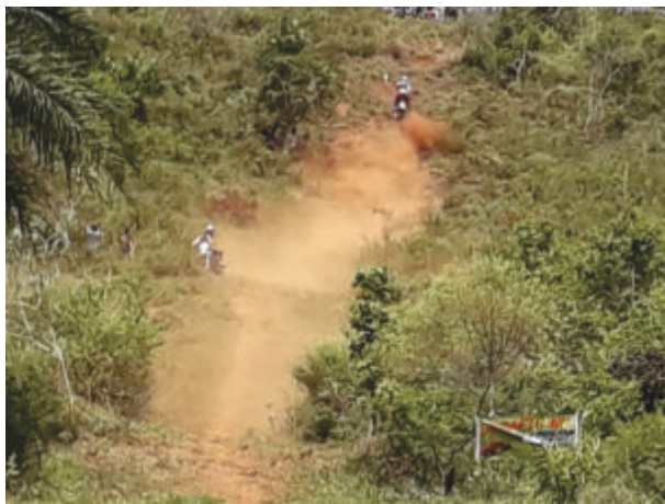
Após de alguns quilômetros, o desafio. Ninguém chegou ao final e os melhores levaram prêmios