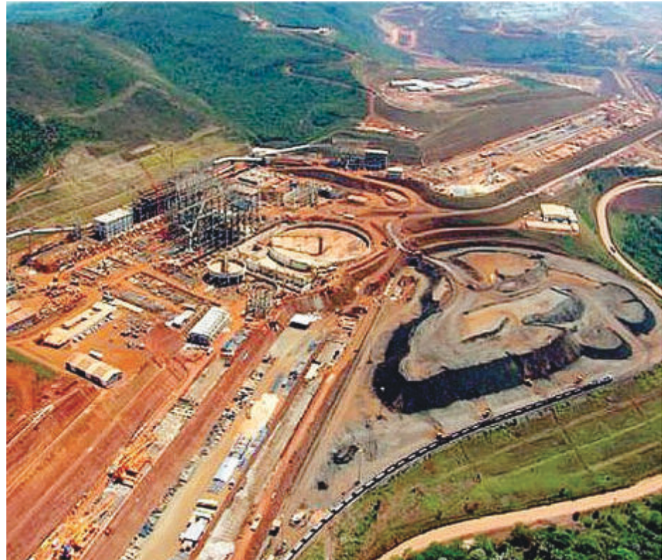
Usina, parcialmente paralisada, voltou a operar no último fim de semana

curso do Município e suspendeu a liminar que determinava a suspensão das operações na mina de Brucutu, que voltou a operar no último fim de semana, o repasse da Vale será suficiente para sanar os impactos que poderiam vir a ocorrer devido à queda da arrecadação causada pela paralisação da mineradora nos últimos dois meses.