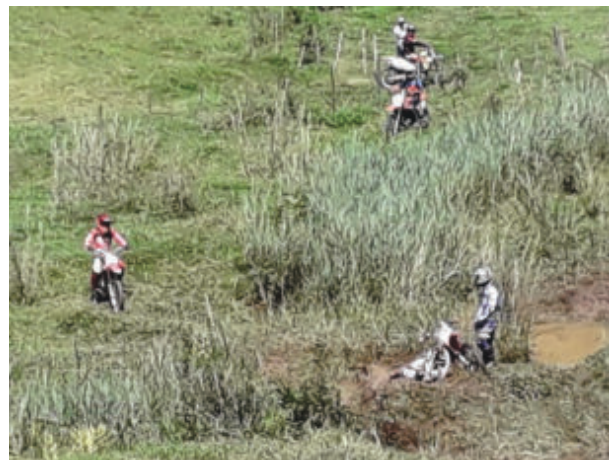
No meio da trilha, alguns atoleiros para testar a paciência e resistência dos pilotos