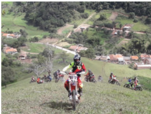
Depois da largada, força e equilíbrio para concluir a segunda e mais longa subida