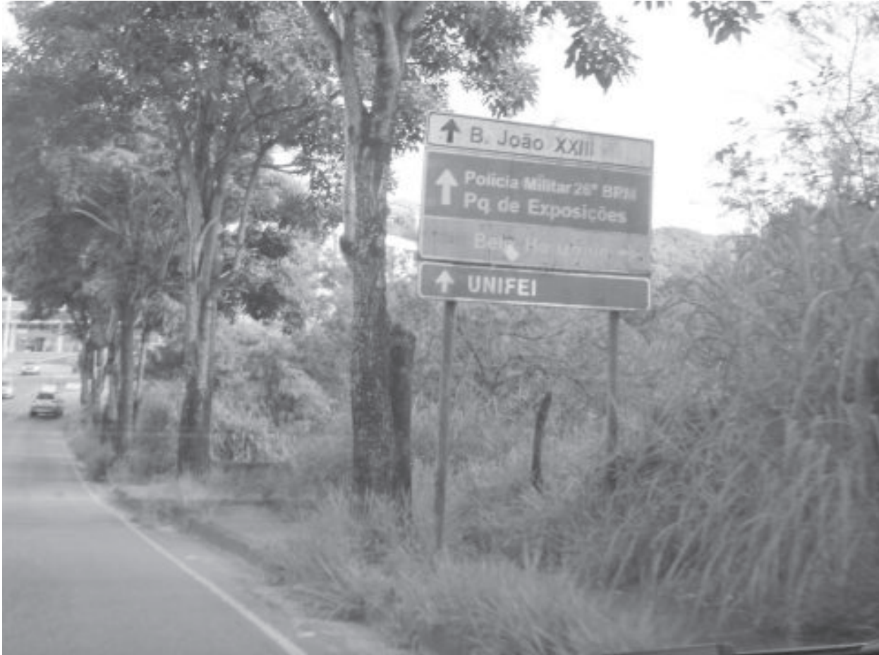
Riscos de proliferação de animais peçonhentos e do mosquito Aedes aegypti – transmissor da dengue, zika, chikungunya e febre amarela aumentam com lotes e terrenos sujos

A multa é de 100 Unidade Padrão Fiscal do