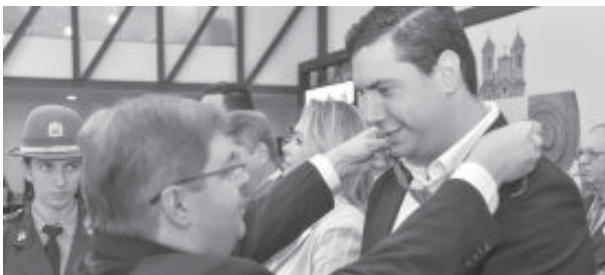
Medalha foi entregue no domingo, dia 21