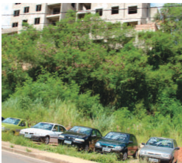
Na cidade, são vários terrenos sujos

Depois de 58 dias, Brucutu volta a produzir em escala normal