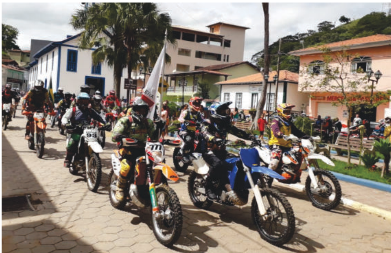
Depois da bênção na praça da Matriz de São José os pilotos fizeram desfile com bandeiras até o campo de futebol, de onde saíram para a trilha

O valor simbólico cobrado para acesso ao evento, R$ 5 por pessoa, foi repassado ao Hospital Municipal de Passabém. Conforme os organizadores, o dinheiro irá garantir a compra de diversos materiais de uso diário.