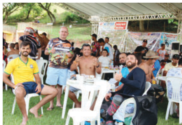
Trilheiros aprovaram a trilha e a bela recepção