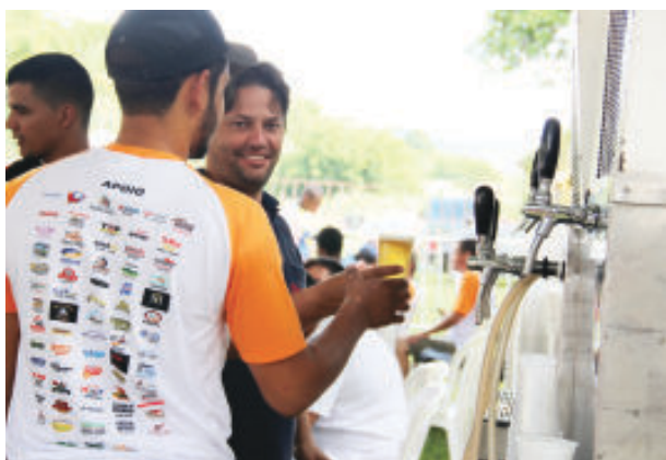
Na recepção, chope artesanal e um ótimo almoço