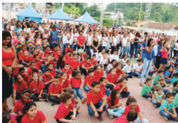
Comunidade e estudantes durante as apresentações

No domingo, às 11h, a paróquia promoveu a carreata pelas ruas da cidade em louvor ao padroeiro São José. Às 15h, teve missa solene da festa e procissão com a imagem de São José e apresentação da Guarda de Marujos de Boliva.