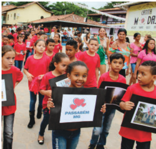
Estudantes apresentaram as riquezas da cidade

No sábado (16), às 8h, foi realizada a caminhada cívica ao som da banda Euterpe Lagoana, de Nova Era, saindo do Cemitério da Mônica, passando pela rua das Palmeiras, com três paradas para recital de poemas, contornando a praça São José até a Quadra 19 de Março. O tema neste ano foi a "Valorização e cuidados do nosso espaço". Participaram da caminhada profissionais de ensino, servidores municipais,