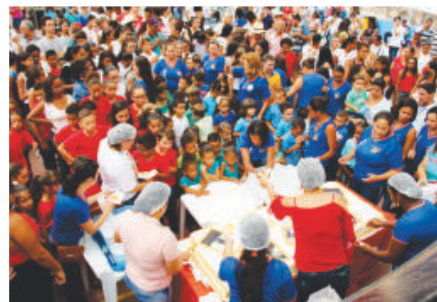
Bolo gigante foi distribuído para o público