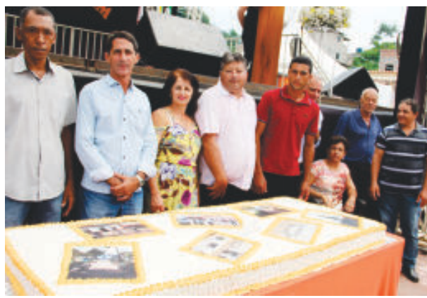
Prefeito, vice e vereadores durante o parabéns