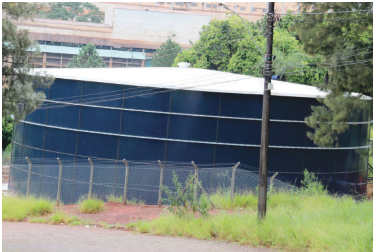
A proposta é captar água do rio Tanque, a 21 quilômetros de distância, até o novo reservatório instalado no bairro Campestre, acrescentando 200 litros por segundo (l/s) ao volume existente hoje

No projeto anterior, de 2015, o objetivo era captar 400 l/s, o que custaria cerca de R$ 80 milhões. Mas, de acordo com novos estudos técnicos, 200 l/s são suficientes para atender Itabira. Além disso, segundo Leonardo Lopes, havendo necessidade em aumentar a captação, o rio Tanque outorga até 1.000 l/s conforme legislação vigente.