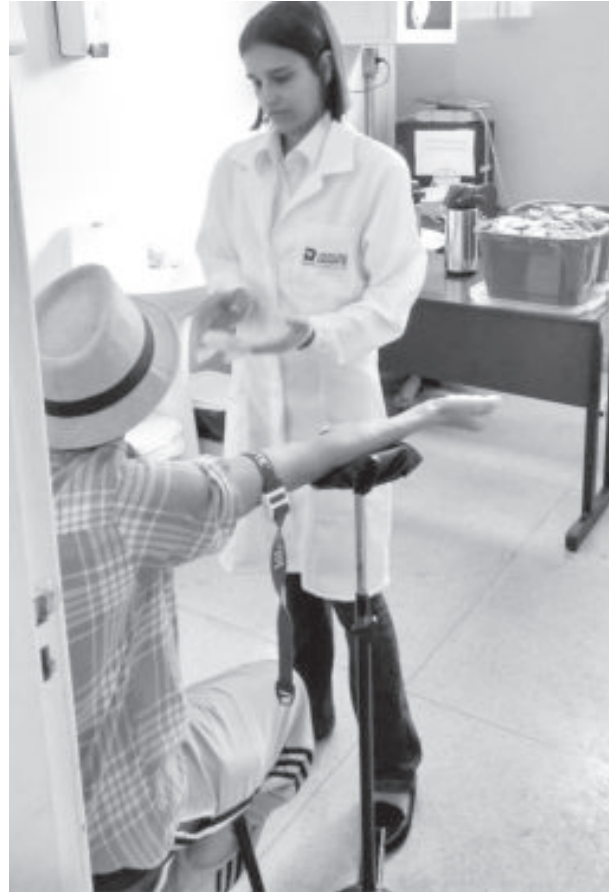
Atendimentos começaram dia 18 deste mês

Todos os exames realizados pelo Laboratório Duarte, dentro do convênio do Ciscel com a Secretaria Municipal de Saúde, serão pagos pela tabela SUS.