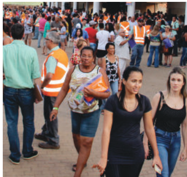
Mais de 3 mil pessoas participaram da ação

Neste final de semana, os simulados de rompimento da barragem Sul Superior acontecem nas cidades de São Gonçalo e Santa Bárbara. Estes dois municípios, conforme previsão, seriam atingidos pelos rejeitos em 3h16m.