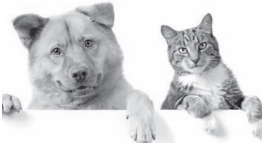
Com dinheiro liberado, próximo passo será abrir o processo de licitação para credenciar as clínicas que farão as castrações