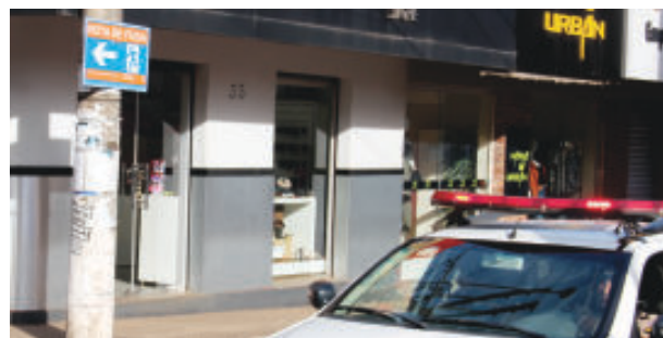
Viaturas e carros com sirenes e áudio movimentaram toda a região dentro da área da mancha

A Defesa Civil Mineira informou que, desde terça-feira (26), está em curso a nova fase da operação de prevenção de riscos. O trabalho consiste em visitas às casas das pessoas nas áreas que podem ser atingidas pelo rompimento para reforçar os procedimentos de segurança. Além disso, haverá atenção especial às pessoas com deficiências. Sugestões dos moradores sobre o simulado também serão incluídas no plano de ação final.