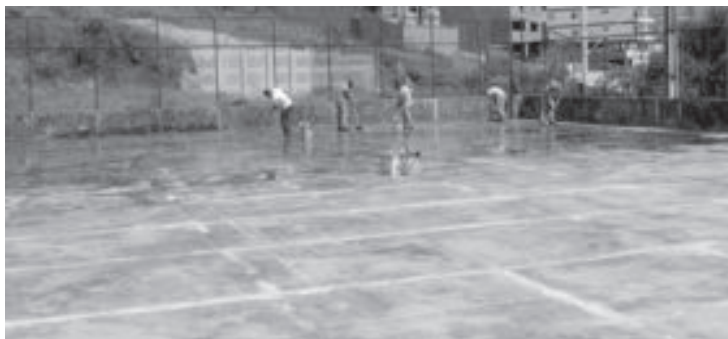
O custeio da reforma nos dois espaços soma R$ 67,8 mil

Engeita Engenharia, deve concluir a revitalização em abril. As melhorias ocorrem em toda a estrutura: piso, luminárias, pintura e alambado, por exemplo.