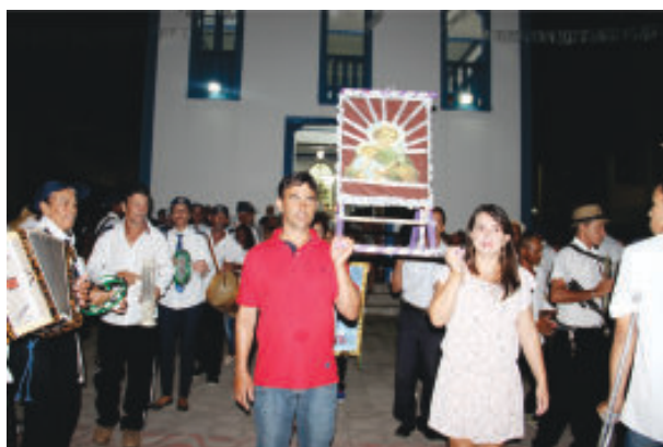
Festeiros do ano com a bandeira de São José