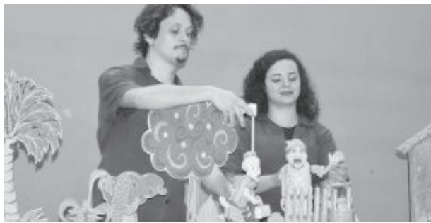
A peça propõe uma reflexão socioambiental