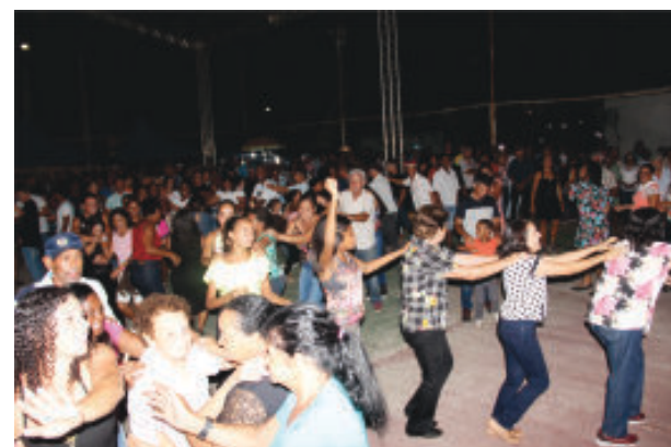
Festa teve ainda shows musicais e descontração