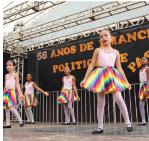
Alunas do ensino infantil fizeram apresentações