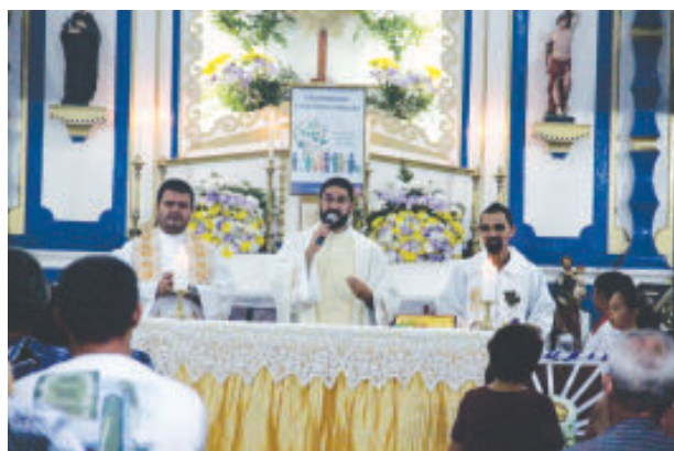
Missa festiva em louvor ao padroeiro