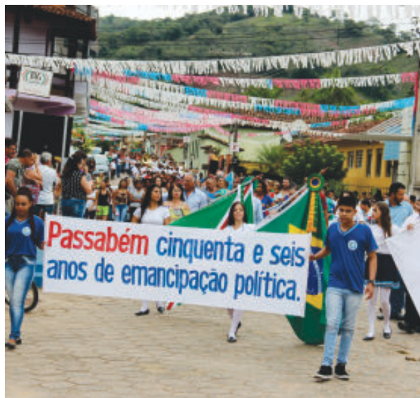
Comemorações tiveram início com desfile cívico

VEJA MAIS FOTOS E VÍDEOS EM facebook.com/ofolhanews/