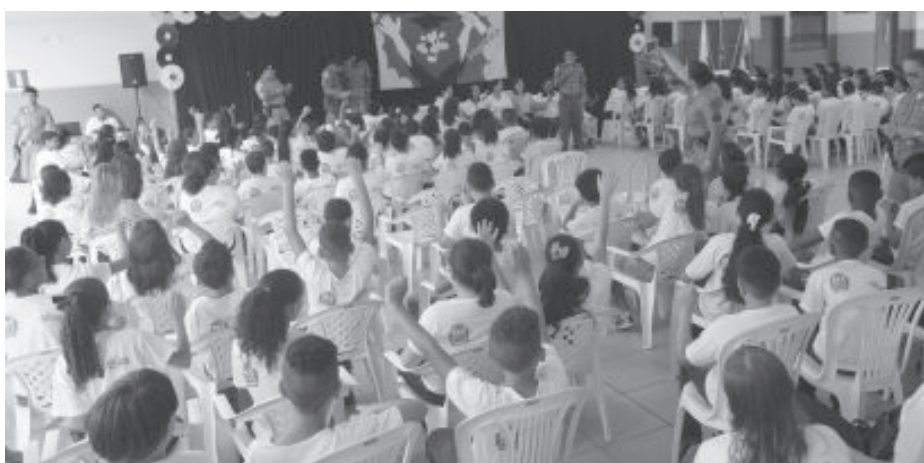
A cerimônia foi realizada na Escola Integral e reuniu dezenas de pessoas

Participaram do curso alunos da Escola Integral Maria de Lourdes Duarte Moreira dos Santos, Escola Integral de Vargem