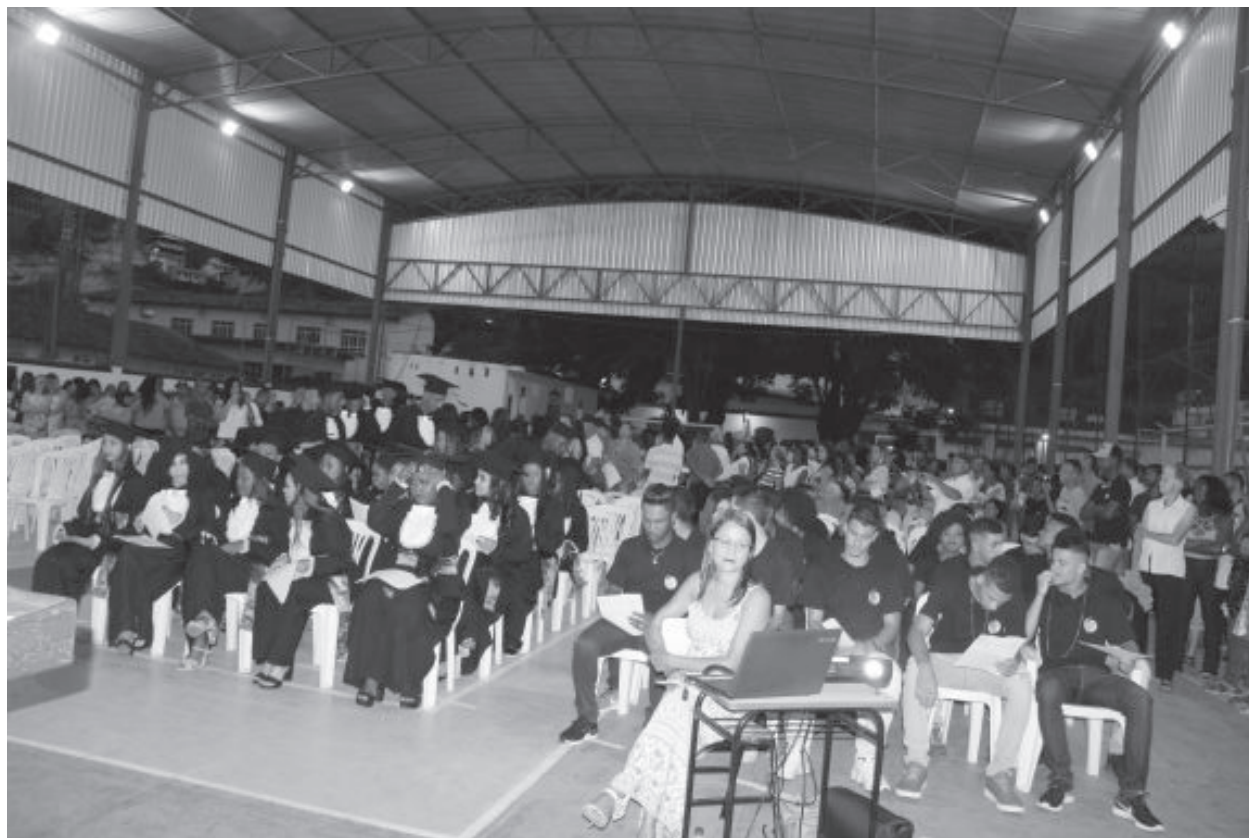
Evento de formatura aconteceu no ginásio coberto do Smec no dia 5