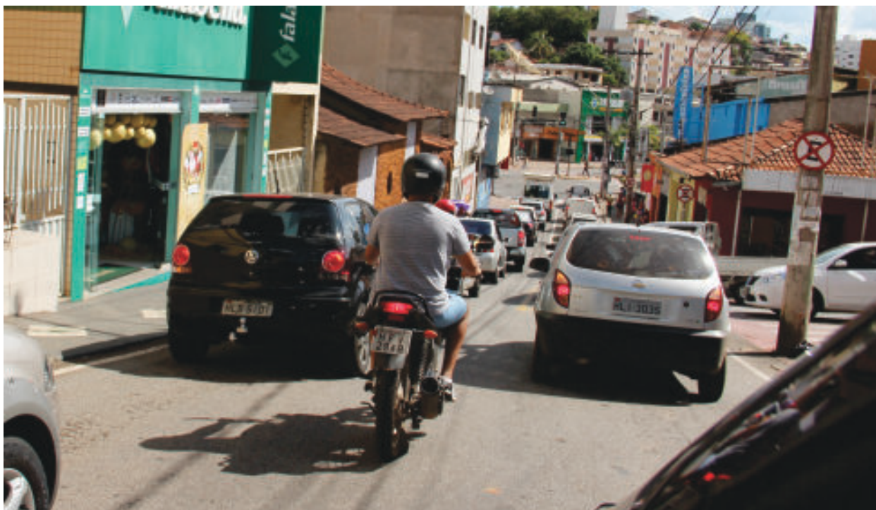
Itabira irá gerar maior receita em IPVA, mais de R$ 31 milhões em 2019