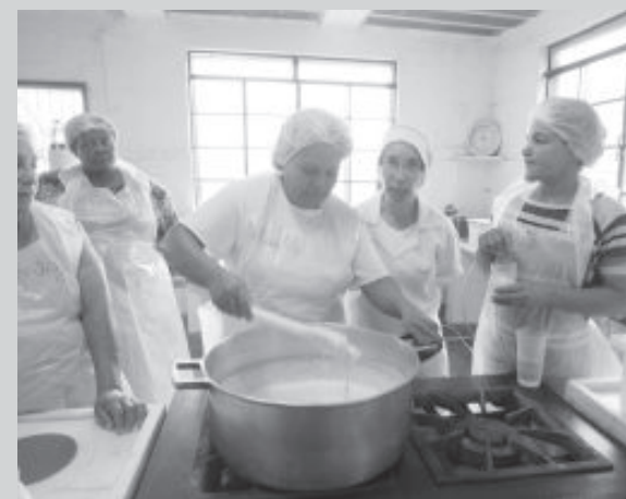
Alunos durante o curso do Senar

No Centro de Processamento de Alimentos (CPA), onze alunos foram qualificados gratuitamente pelo Serviço Nacional de Aprendizagem Rural (Senar-MG) através de convênio com o Sindicato Rural de Itabira.