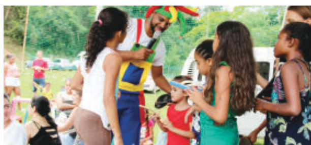
Gincana e jogos de adivinhação fizeram a criançada correr para cumprir as provas