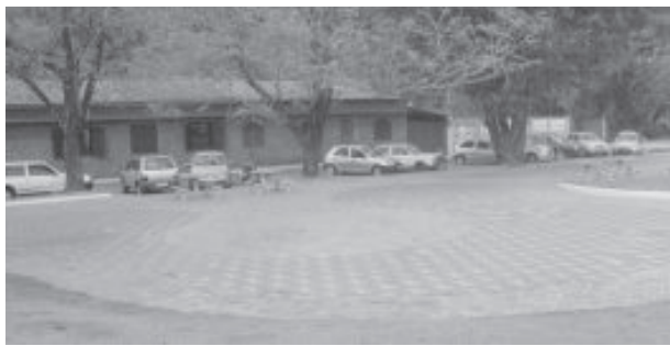
Local que receberá praça de lazer