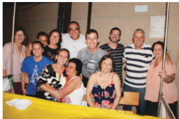
Pausa para foto. Colaboradores nas barraquinhas durante o show na quadra