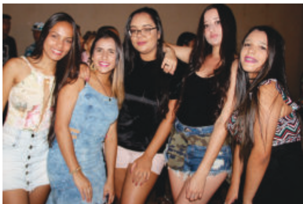
Público aprovou o retorno dos eventos na quadra poliesportiva