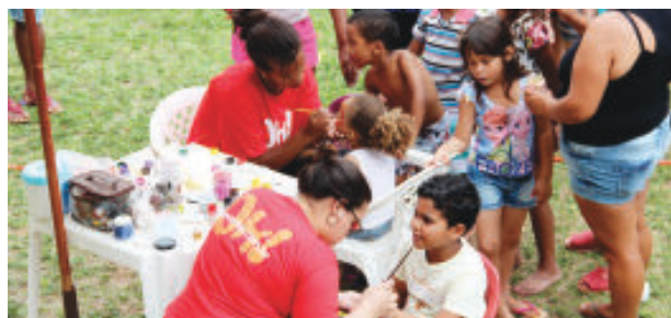
Na pintura facial meninos e meninas tiveram a oportunidade de se transformarem em super-heróis

Foram 11 brinquedos infláveis. Sem dúvida, a maior atração foi o futebol molhado, que formou grande fila durante todo o dia