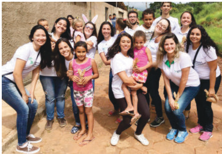
Estudantes da ONG Engenheiros sem Fronteiras

A entrega será feita na própria escola, no dia 20 de outubro, em um evento que ocorrerá das 8h às 12h30. Os voluntários promoverão brincadeiras e lanche para a comunidade local e, para tal, também podem ser doados mantimentos como pão, salsi-