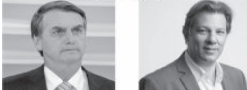
Jair Bolsonaro (PSL) Fernando Hadadd (PT)