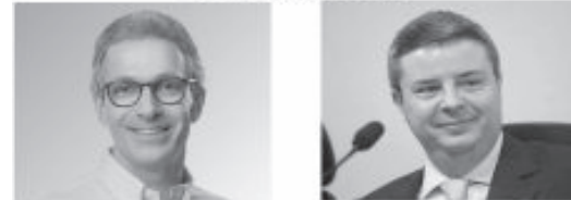
Romeu Zema (Novo) Antônio Anastasia (PSDB)