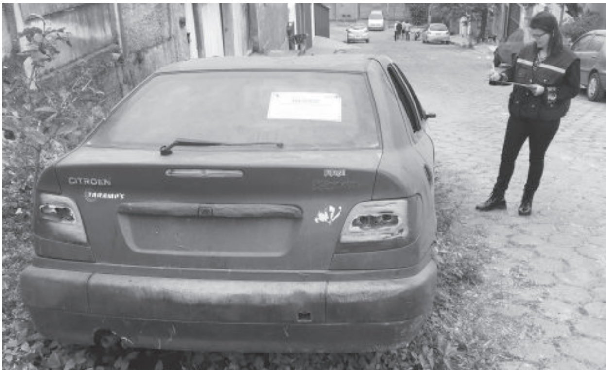
Carcaças e carros abandonados começaram a ser retirados das ruas em agosto

Nesta segunda-feira havia 26 veículos no trâmite de advertência. Os automóveis em situação irregular ocupam vagas, obstruem vias, servem de abrigos para transmissores de doenças e criminosos. "A gente acredita que é uma ação que está dando muito certo, bem acolhida pela comunidade e resultando em melhorias de limpeza, das condições de segurança e saúde de nossa cidade", comentou o secretário de Obras.