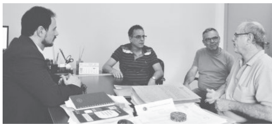
No encontro, ocorrido no dia 11, ficou definido que as audiências terão divulgação ampla, objetivando garantir a participação e controle social