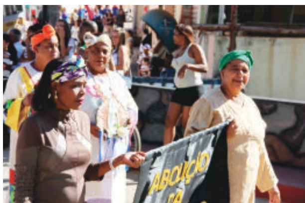
Como manda a tradição, durante a procissão, temas importantes foram lembrados