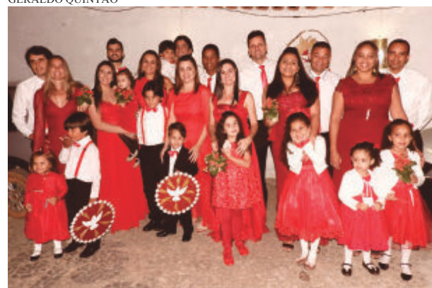
Família e amigos que também se empenharam para ajudar a manter o brilho e a fé da festa