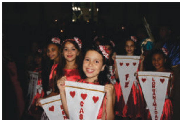
Crianças com bandeiras alusivas às tradições da Festa de Setembro de São Sebastião