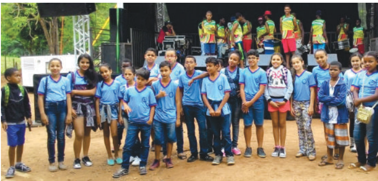
Alunos do 5º ano (2017), que foram avaliados, em visita ao Barro Preto, comunidade quilombola em Santa Maria de Itabira

Cumprir a meta projetada do Índice de Desenvolvimento da Educação Básica (Ideb), 2017/2018, do ensino fundamental municipal, com antecedência de quatro anos, e ainda com sobra, é motivo de orgulho para a comunidade escolar de Santo Antônio do Rio Abaixo. A boa notícia foi publicada no dia 3 de setembro, após análise da qualidade do ensino de todas as escolas do país.