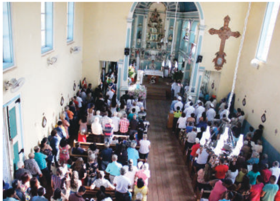
Praça e Igreja da Matriz, mais uma vez, foram palco da grande festa