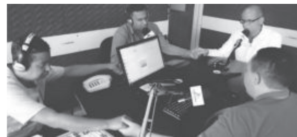
Anúncio foi marcado por oração