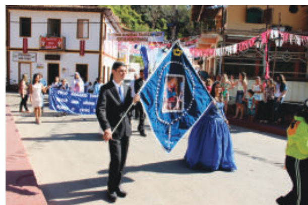
Procissões, com bandeiras e cartazes, e missa especial no domingo encerraram a festa