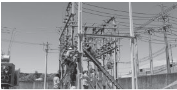
Subestação será no bairro Jardim Buritis