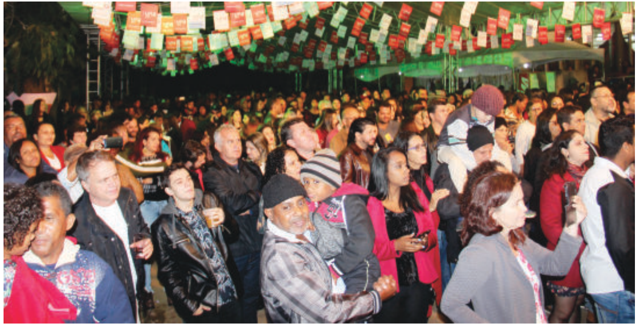
Quem prestigiou o II Festival de Inverno de Santa Maria aprovou. Foram quatro dias de festa cultural

O II Festival de Inverno de Santa Maria de Itabira, promovido pela Prefeitura entre os dias 12 e 15 de junho, atraiu grande público, mostrou força regional e passou a fazer parte do calendário de eventos oficiais do município.