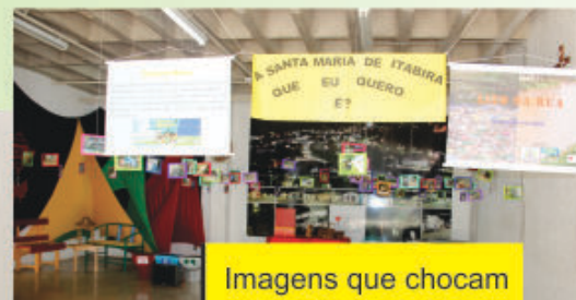
Imagens que chocam = sem lixo nas ruas

A Câmara de Santa Maria de Itabira e a Fundação Francisco de Assis promoveram, entre os dias 9 e 13 de julho, por meio do projeto Câmara Mirim, várias atividades pela conscientização contra o lixo nas ruas, exposições de recicláveis, varal com fotos e palestras contra as drogas para alunos da rede de ensino da cidade.