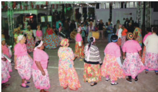
Grupo de dança circulares Neste Chão encantou o público com o colorido e canções quilombolas