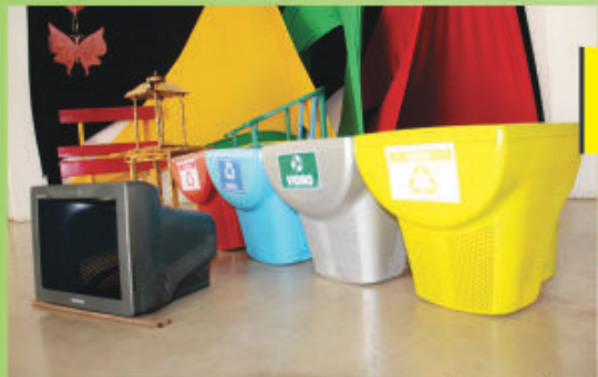
Carcaça de monitor = lixeira

Inservíveis = produtos para decoração e uso