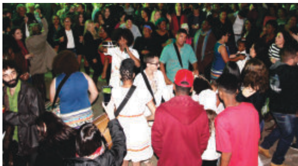
No meio do público, Grupor Meninos de Minas tirou todos do chão com os batidos eletrizantes