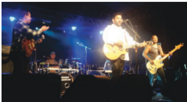
Em alto nível, Legião cover lembrou os sucessos de Renato Russo