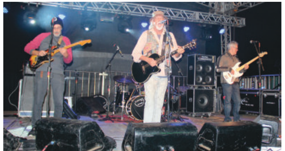
Grandes nomes da MPB, como Zé Geraldo (foto), e artistas regionais enriqueceram a programação

Na sexta (13) a programação começou cedo, com a segunda edição da Ação Cívico Social, das 8h às 15h, e apresentação teatral da Trupe Gaia. Já no início da noite, ocorreu a quadrilha e logo