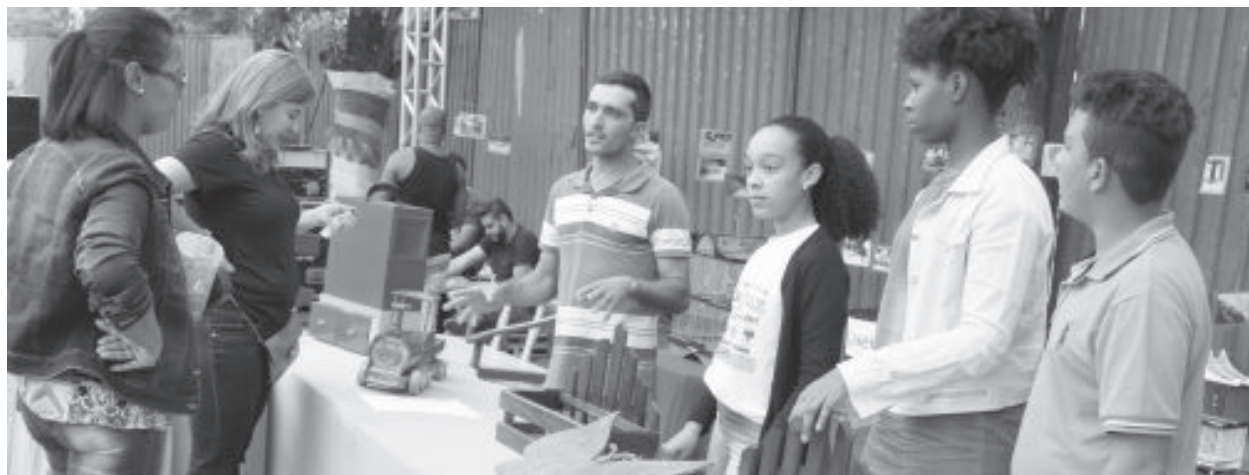
Durante a semana, vereador e componentes do Câmara Mirim falaram do projeto ao público

Além da questão do lixo, a Câmara Municipal