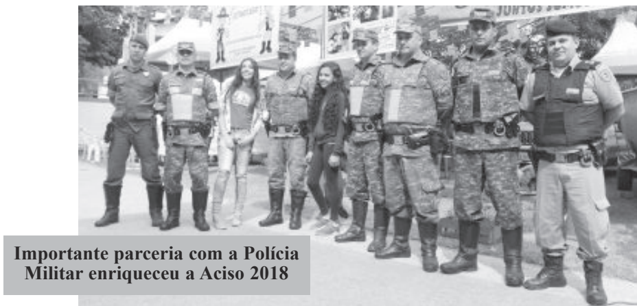
Importante parceria com a Polícia Militar enriqueceu a Aciso 2018

Já a programação completa aconteceu na sexta (13), com rua de lazer, aferição de pressão e glicemia, presença do Leão Daren (Proerd), estandes do Cras, PM Legal e Câmara Mirim, exposição de animais empalhados e barco da Polícia Florestal, caminhão e