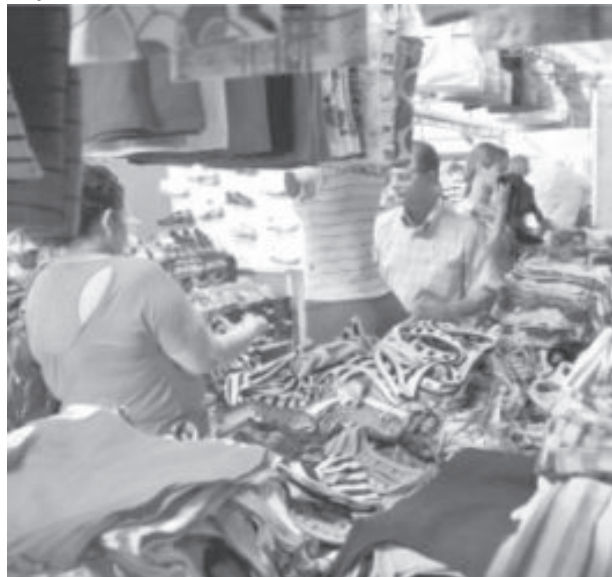
Proposta aprovada pela Câmara busca regulamentar as feiras itinerantes

As conhecidas feiras itinerantes terão que cumprir regras para montarem barracas em São Gonçalo do Rio Abaixo.