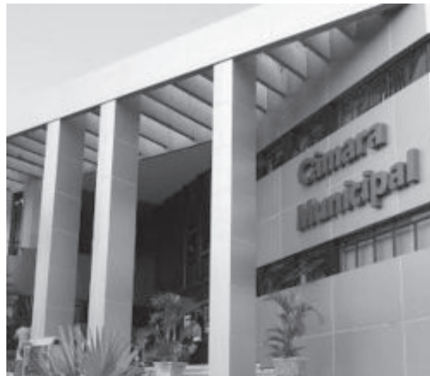
Em Itabira, Legislativo tem estrutura diferenciada

Em nível estadual, na Assembleia Legislativa de Minas o deputado Leo Portela (PR) apresentou no início de junho dois requerimentos sugerindo o corte dos salários dos parlamentares mineiros pela metade, o que reduz também subsídios de vereadores no estado, e a redução do número de