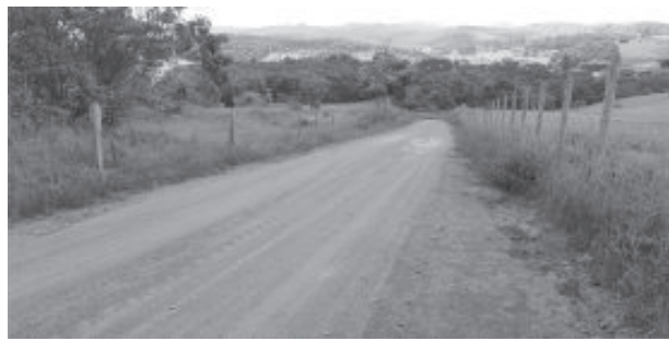
Serviço foi entre o Córrego João Alves e Bileto