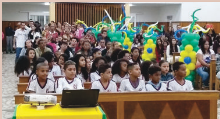
Solenidade reuniu alunos, professores, pais e autoridades

Na noite de 3 de julho, a Matriz de Nossa Senhora do Rosário, em Santa Maria de Itabira, ficou pequena em virtude da formatura dos alu-