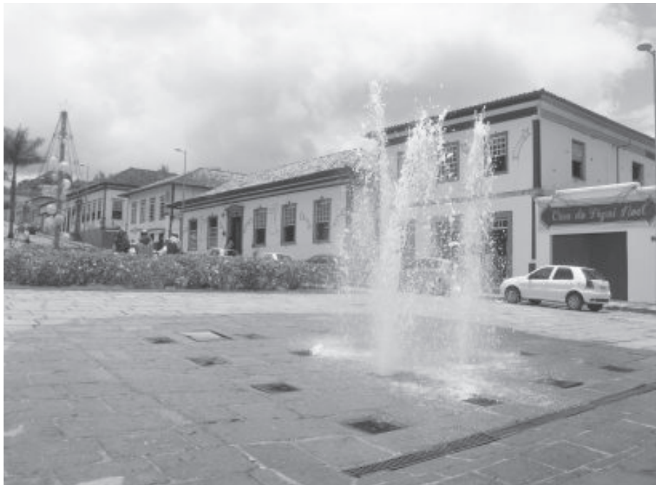
Repartições da Prefeitura de Santa Bárbara na praça Cleves de Faria, onde funciona também a Jucemg Minas Fácil e Sala Mineira do Empreendedor

empreendedor consiga abrir o próprio negócio em no máximo nove dias.