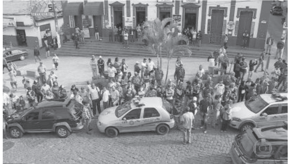
Operação no final de julho de 2017 mobilizou grande aparato policial, órgãos de imprensa e atraiu curiosos

Os 10 vereadores e dois suplentes afastados em julho de 2017 (quatro estão presos na cadeia de Barão de Cocais) são acusados de montar um esquema de desvio de recursos por meio de contratos fictícios com locações de carros entre 2015 e 2017, que pode ter ge-