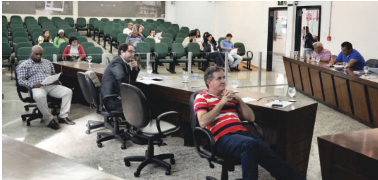
Vereadores e pequeno público acompanham a apresentação das finanças do Município