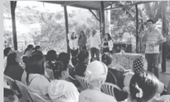
Antônio Carlos afirmou que segue trabalhando para diversificar a economia e contribuir para o desenvolvimento de São Gonçalo

A Associação de Assistência Social de São Gonçalo do Rio Abaixo (Aassgra) promoveu, na manhã do dia 10, a cerimônia de boas-vindas das 170 pessoas que vão exercer atividades na frente de trabalho.