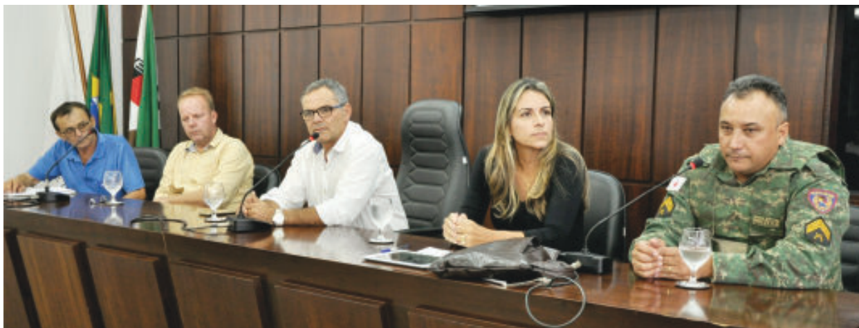
Encontro levantou também questões como atear fogo em resíduos, cultura que deve ser desmistificada