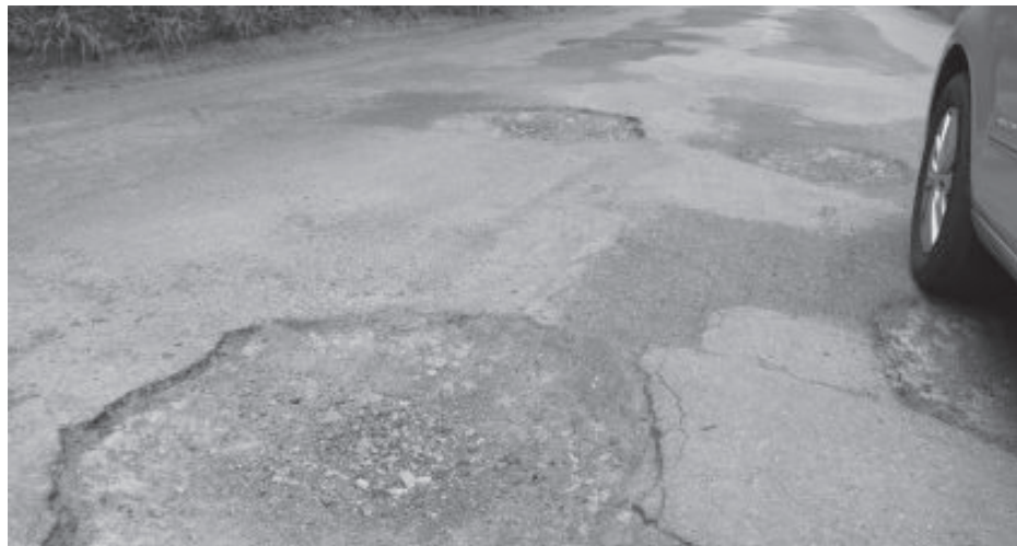
São tantos buracos que sair deles é missão impossível

Prova disso é um pedido de estadualização da rodovia protocolado no Departamento de Estradas de Rodagem (DER-MG). Passando a ser de responsabilidade do DER, o novo recapeamento, que pode chegar a R$ 4 milhões, tem chance de ser realidade.