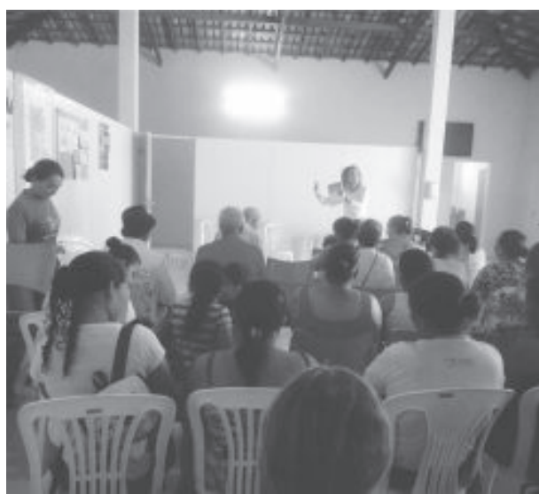
Encontro com moradores da comunidade de Vargem Alegre

Entre os principais programas sociais para os usuários do Cadastro Único estão Bolsa Família; Tarifa Social de Energia Elétrica, com desconto na conta de luz; Carteira do Idoso; Carta Social; Minha Casa Minha Vida; Facultativo de Baixa Renda, que visa contribuir para o INSS mais barato; Telefone Popular; isenção de pagamento de taxa de inscrição em concursos públicos; Benefício de Prestação Continuada da Assistência Social (BPC) e Identi-