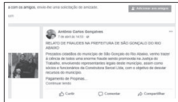
Situação chamou a atenção após uma publicação no Facebook apontando fraudes

Ainda em relação aos processos, o Governo