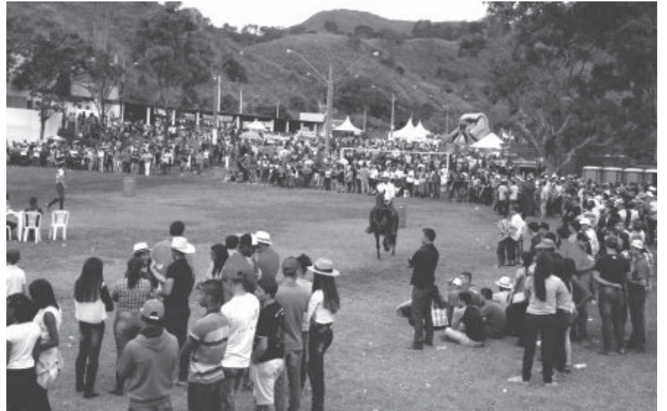
A tradicional cavalgada no ano passado atraiu grande público

Conforme a nota, os repasses realizados pela União e pelo Governo Estadual são a base econômica da maioria das prefeituras do Brasil, principalmente das pequenas cidades que não têm grandes indústrias, nem recursos minerais para engordarem suas arrecadações. Com os sucessivos atrasos nos repasses, sem explicação, os municípios têm vivido uma crise sem precedentes. Os investimentos em saúde e educação, por exemplo, não podem parar em função dos atrasos e com isso, os municípios precisam investir seus próprios recursos para manter o transporte escolar e a merenda disponível nas escolas; medicamentos, transporte e equipes disponíveis à população nos postos de saúde e nas farmácias populares. Além de lidar com a queda acentuada das receitas devido à economia em baixa, os atrasos tiram o poder de ação dos municípios de-