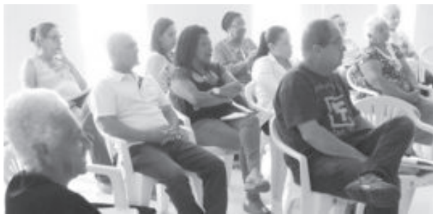
As aulas aconteceram no prédio da Secretaria de Saúde