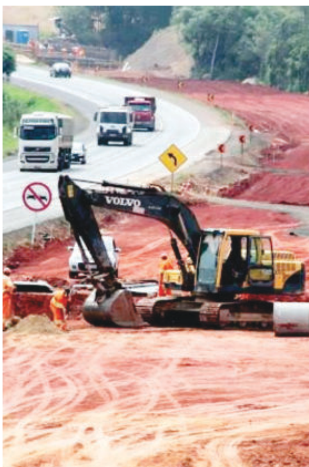
Obras na BR-381 seguem acompanhadas por cidades e entidades, ao contrário de Itabira