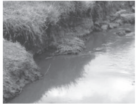
A população de Santo Antônio do Grama foi alertada para não usar a água do ribeirão Santo Antônio

A licença ambiental da Anglo American para operar o mineroduto Minas-Rio continua suspensa pelo Instituto Brasileiro do Meio Ambiente e dos Recursos Naturais Renováveis (Ibama) após o segundo vazamento de polpa de minério em menos de 20 dias, ocorrido na noite de quinta-feira (29).