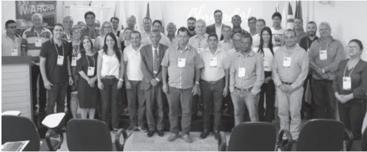
Encontro contou também com a presença de prefeitos, vices e secretários de várias cidades

O sétimo encontro do projeto Ação Municipalista em Minas Gerais, reuniu gestores e secretários de mais de 15 cidades da região na sede da Associação dos Municípios do Médio Rio Piracicaba (Amepe), em João Monlevade, no dia 27 de março.