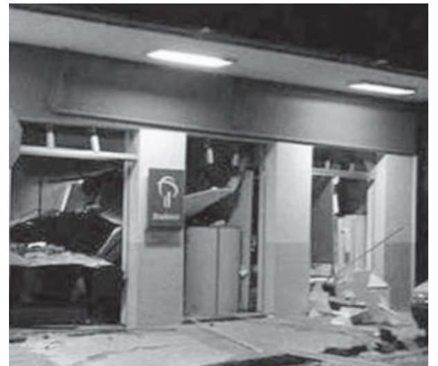
Em maio de 2014 bandidos explodiram caixas do Bradesco na cidade