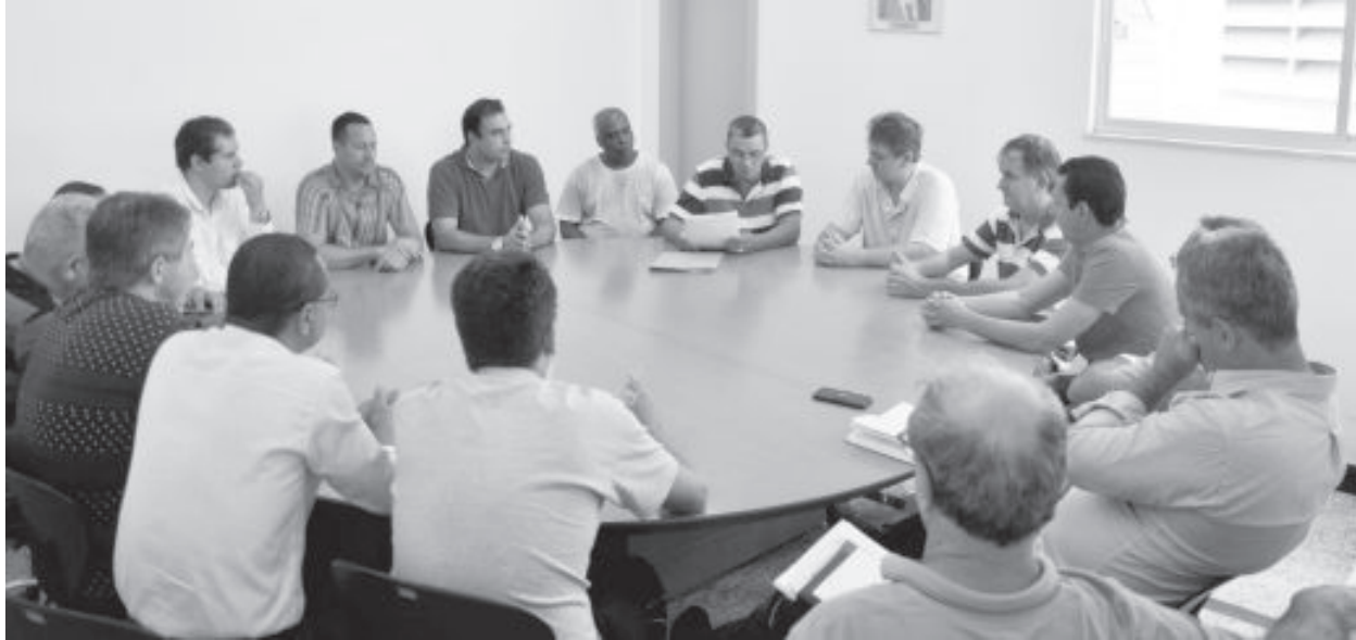
Empresários cobram o cumprimento de lei que objetiva uma infraestrutura adequada de trabalho no Distrito Industrial