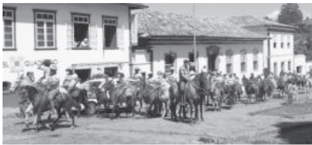
Concentração de cavaleiros será na praça da Matriz