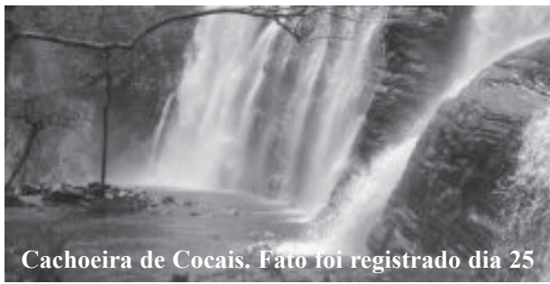
Cachoeira de Cocais. Fato foi registrado dia 25