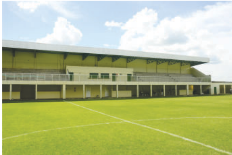
Arena tem capacidade para oito mil pessoas e um campo nos padrões oficiais estabelecidos pela Federação Mineira de Futebol