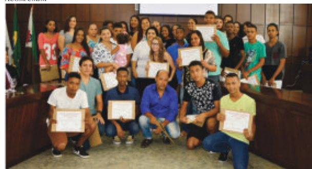
Certificados foram entregues dia 25, na Câmara

A Prefeitura de João Monlevade, através do CAT/Sine, realizou no dia 25, no plenário da Câmara Municipal de João Monlevade a entrega de certificados aos concluintes do curso competências profissionais e sociais ao trabalhador. A certificação foi entregue a 135 jovens, entre 14 e 24 anos.