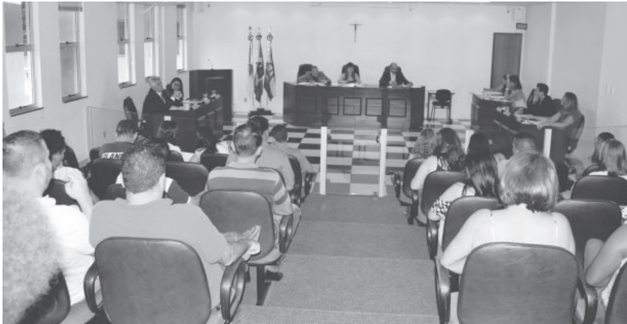
Encontro dos vereadores com a comunidade marcou a abertura do ano legislativo 2018