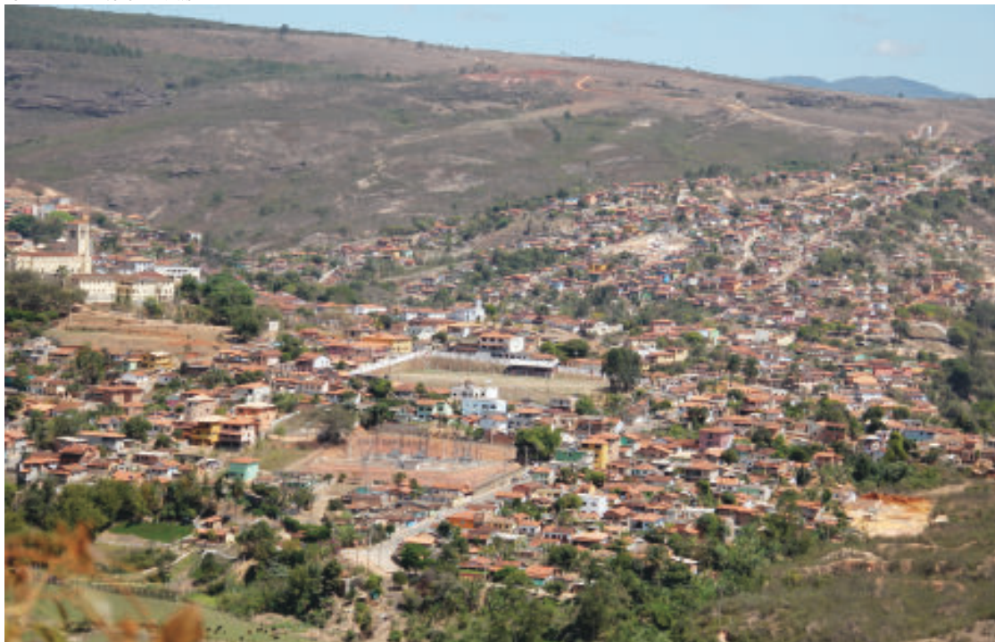
Vista panorâmica. O anúncio da etapa 3 não provocará grandes impactos demográficos em Conceição do Mato Dentro como no início do projeto