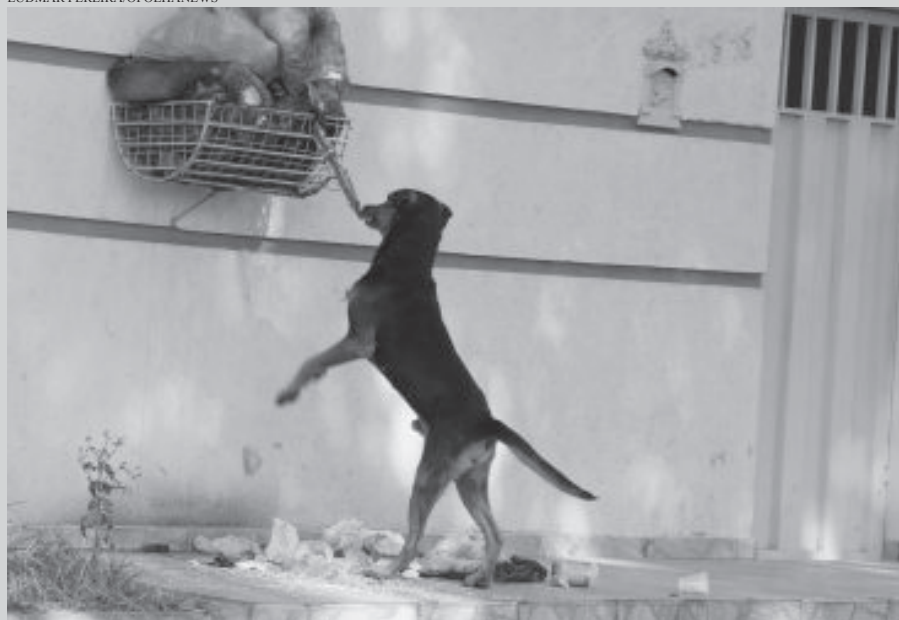
População de cães abandonados é grande. Projeto ganhará força com conquista de unidade própria de castração, prevista para este ano

município. “Estamos falando de saúde pública. Os cães que estão nas ruas, doentes, passando fome e sendo maltratados vieram de uma residência. Então, mais do que cas-