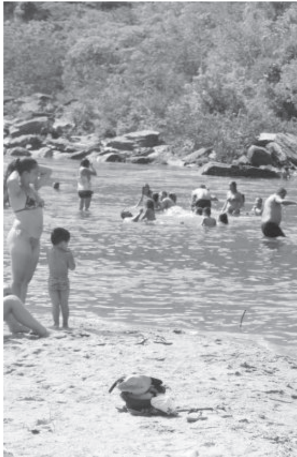
Independente de atração pública, município das corredeiras e cachoeiras atrai grande público