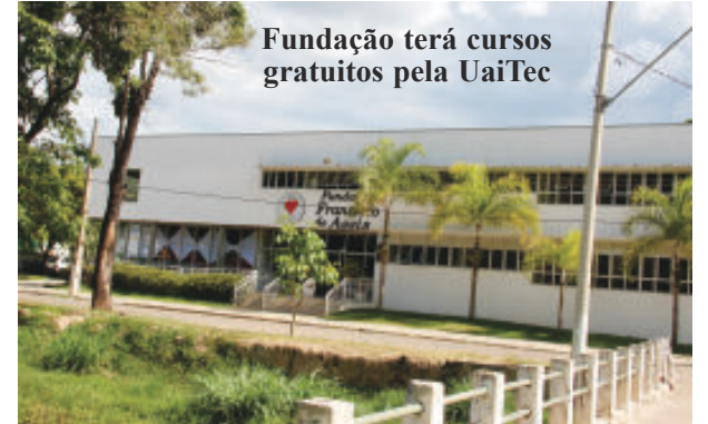
Fundação terá cursos gratuitos pela UaiTec

implantada nas dependências da Fundação São Francisco de Assis. Serão vários cursos gratuitos que darão aos nossos jovens, e também adultos, formação e a oportunidade de emprego.