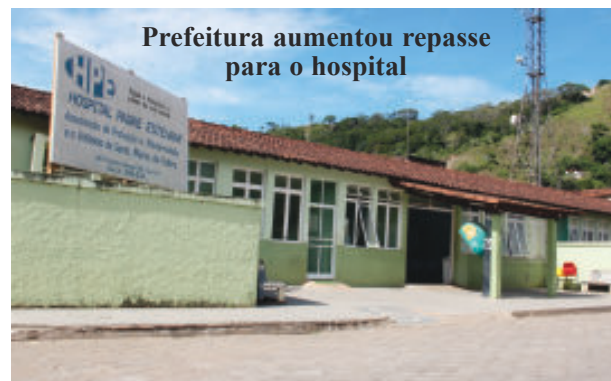
Prefeitura aumentou repasse para o hospital

“Tenho um carinho especial por todas as co-