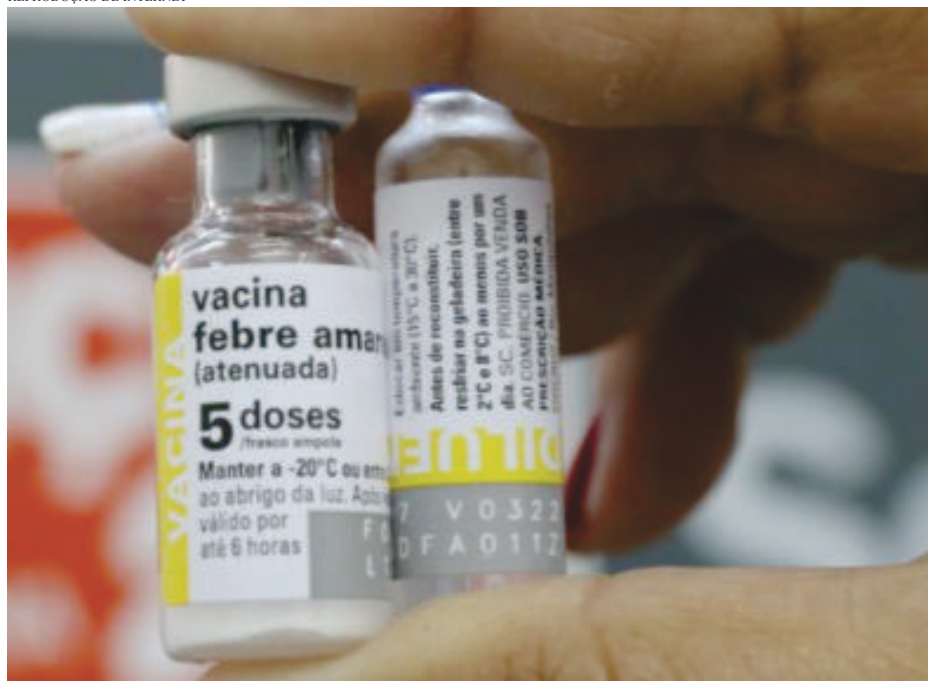
As vacinas devem ser armazenadas a -20°C

gem do Folha Popular não conseguiu informações na GRS até o fechamento desta edição.