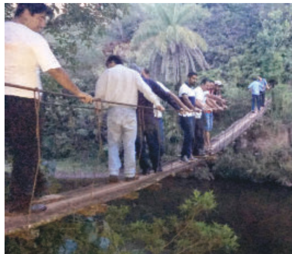
Vereadores observaram o rio e as vantagens de se aplicar a mesma proposta em Barão

Vereadores de Barão de Cocais participaram, na tarde de quinta (25), de uma visita ao distrito de Conceição do Rio Acima, em Santa Bárbara, para conhecer de perto o projeto Rio Vivo.