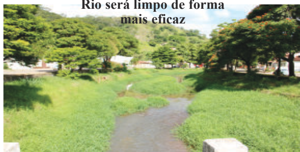
Rio será limpo de forma mais eficaz

“E não é só isso. Creio que em 2017 fiquei mais fora do gabinete do que dentro. Fazendo sabe o que? Indo a Brasília e Belo Horizonte em busca de recursos que, se saírem todos, serão mais de R$ 4 milhões em obras, equipamentos e ações.